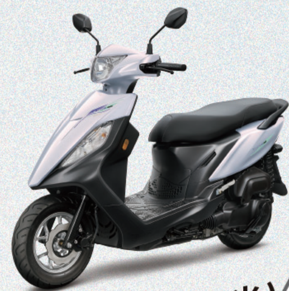
幻光白/白(消光) CBS2.0 碟煞 AL061

導入A.L.E.H.零後仰懸吊系統，起步更安穩。 歐盟認證 安全保證 SYM CBS2.0 連動煞車系統，有效 縮短煞車距離 39%，讓煞停更快更穩。