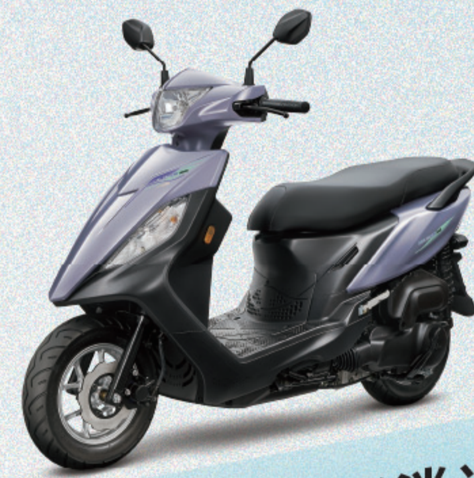
淡嫣紫/銀淺紫(消光) CBS2.0 鼓煞 AL059 CBS2.0 碟煞 AL063