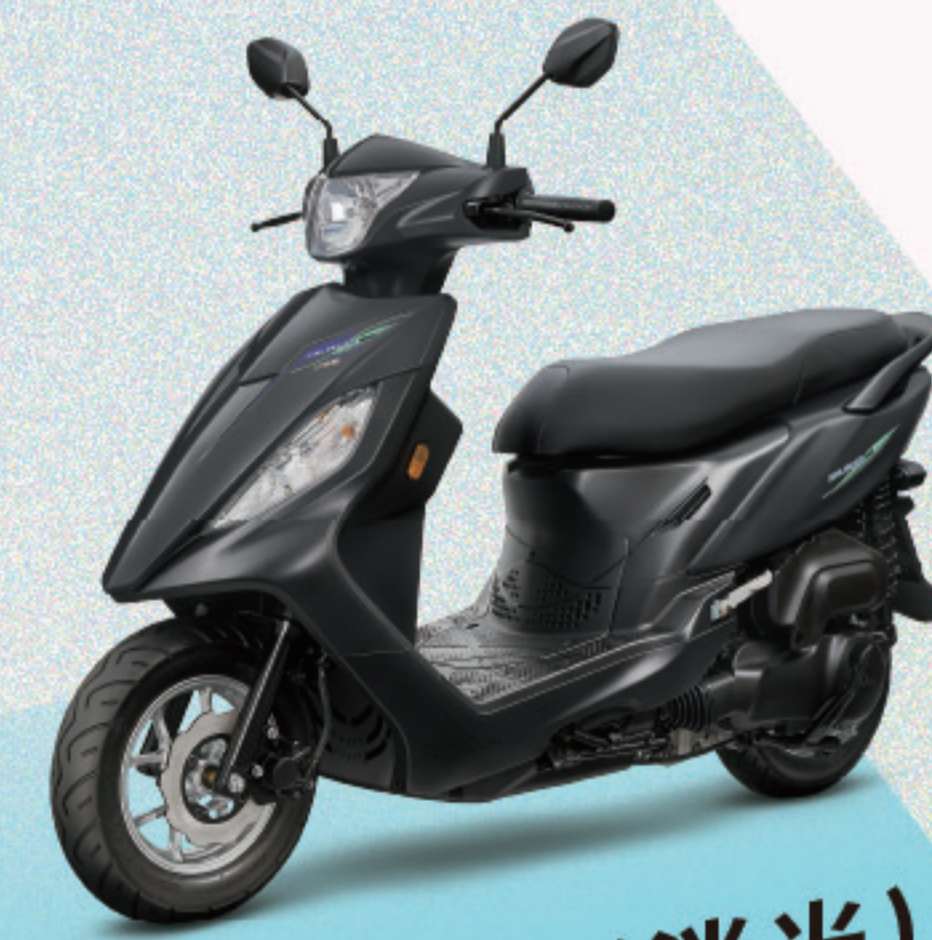
曜石灰/深灰(消光) CBS2.0 鼓煞 AL056 CBS2.0 碟煞 AL060